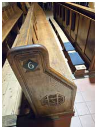
De lange zit-knielbanken van de Nicolaaskerk in Zoetermeer

Knielen heeft een mooie en bijzondere betekenis. Het is immers een teken van nederigheid, waarbij we ons klein maken voor God en ons openstellen voor Zijn genade. Knielen, zo schrijft Anselm Grün, is ons 'door God laten raken, God serieus nemen als de volledig andere die we nooit begrijpen, die ons overweldigt'.