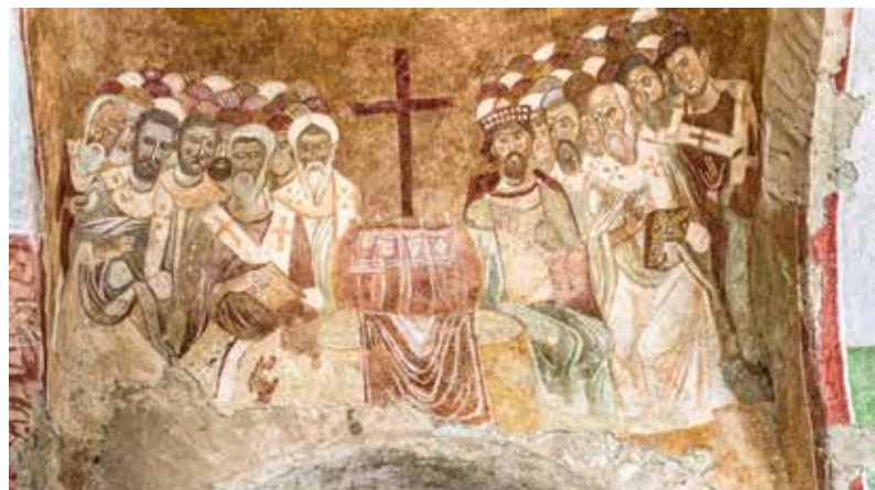
Fresco van de kerkvergadering in Nicea in 325, St. Nikolaas-basiliek, Demre in Turkije

21 JANUARI • In 2025 is het 1700 jaar geleden dat tijdens het eerste oecumenische Concilie van Nicea in het jaar 325 de tekst werd vastgesteld van de geloofsbelijdenis. Deze tekst, die bekend geworden is als de Geloofsbelijdenis van Nicea, is nog steeds het fundament van het geloof van de kerken van Oost en West, van de katholieke kerken en de kerken uit de Reformatie.