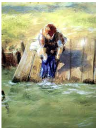
'Vrouw doet geknield de was aan het water', muurschildering historisch Woerden

Deze overdrachtelijke vorm is er een van de vele als het over je knieën buigen gaat. Op het schilderij hieronder is een vrouw afgebeeld die de was doet aan de rand van een rivier. Ook zij buigt haar knieën. Hier gaat het niet om onderwerping, er is geen machtsvertoon. Hier zijn het gebogen knieën tijdens de zware handarbeid. En zo zijn er meer en uiteenlopende vormen en situaties waarin sprake is van gebogen knieën.